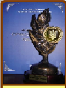
ЛІЦЕЙ - ФЛАГМАН ОСВІТИ УКРАЇНИ